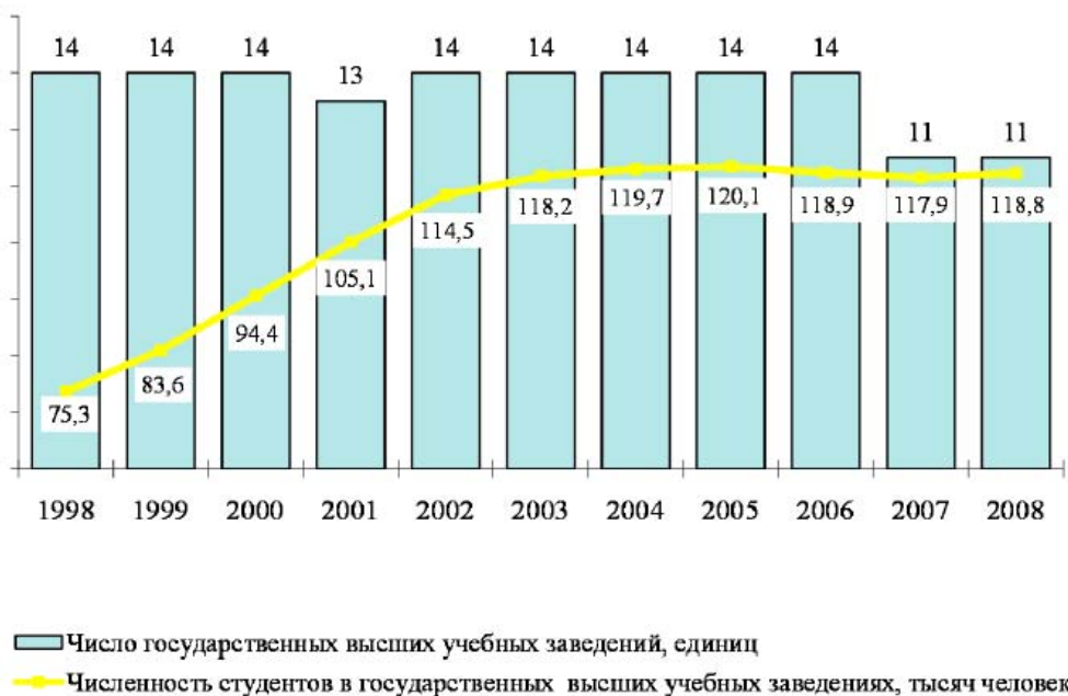
Число государственных высших учебных заведений Красноярского края и численность студентов в них

Общее количество студентов Красноярского края на 2007 г. составило 129,5 тыс. чел., из них 91 % - в государственных и муниципальных учреждениях и 9 % - в негосударственных. 14